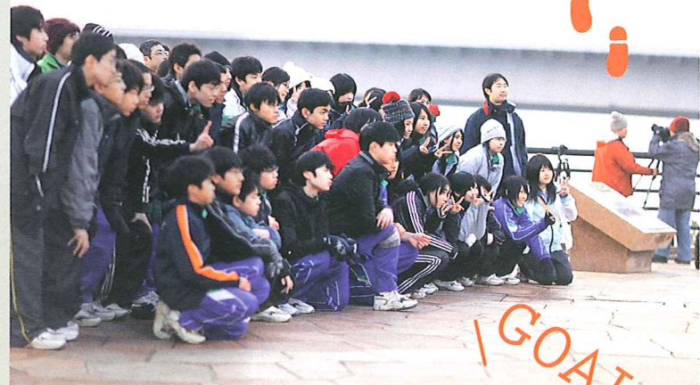
最後は展望台でクラスごとの記念撮影を。その後、生徒たちは今治市内のホテルで朝食をとって帰路についた

「えっ、この子たちここまで夜通し歩いてきたの!」と驚きの声をあげるのは、日の出を撮影しにきた人たち