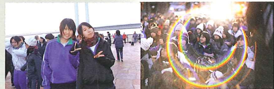
保護者の送る拍手のアーチをくぐって糸山公園にゴールしたのは、まだ日の出前。観光バスのライトを照明代わりにして…