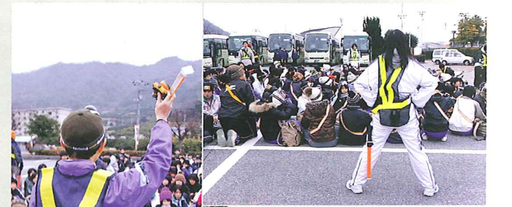
日が暮れてきたので、ヘッドランプと夜光たすきを装着して出発

「今年は結構ペースが速いんじゃない」と言うのは、雨天時の待機用に控えていた観光バスの運転手さんたち