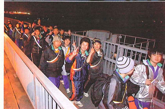
全長約1.5kmの多々羅大橋を渡る。橋の上では時折強い風が吹き、体感温度もかなり低い