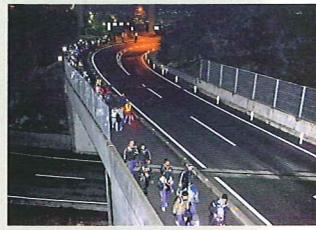
大橋からのループを下りてくる